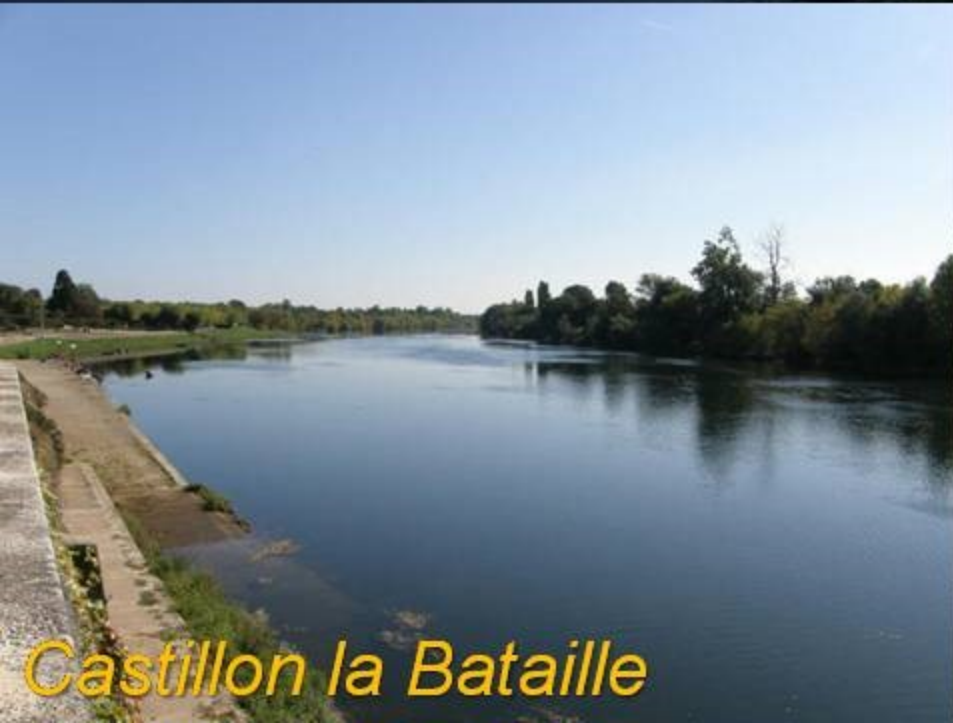
Castillon la Bataille