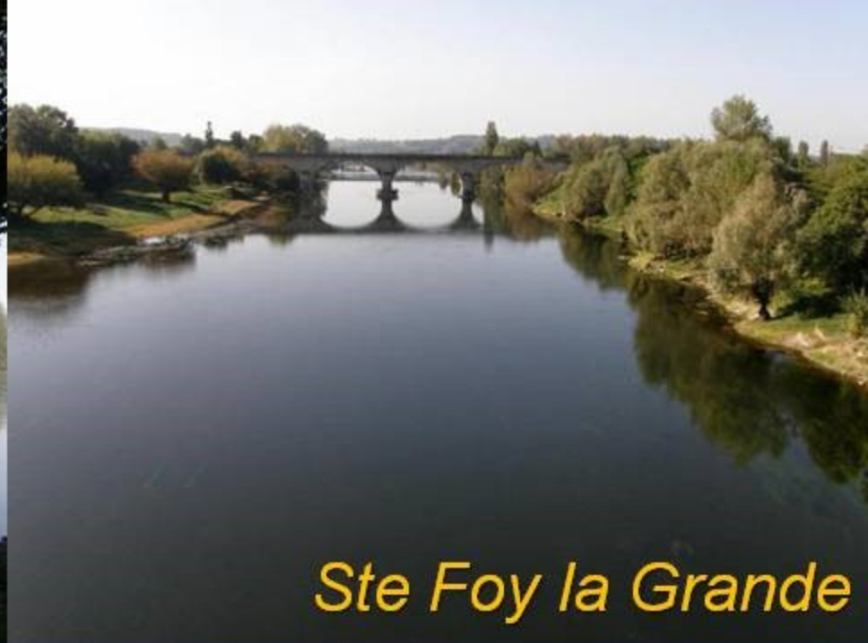
Ste Foy la Grande