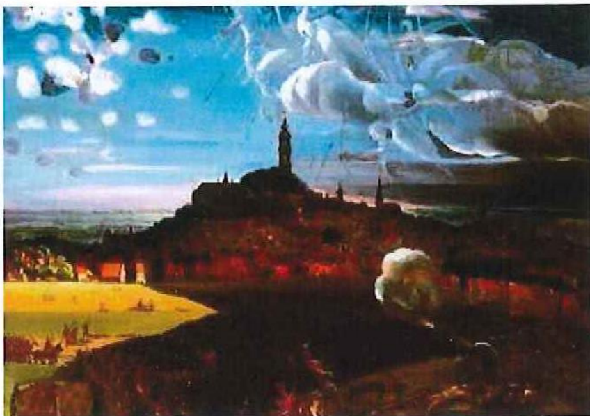
Les Anges de Mons, Marcel Gillis, © Ville de Mons

anges, huit soldats britanniques et deux infirmières également britanniques (celles-ci furent souvent considérées comme les réels Anges de Mons). Les cornemuses et les percussions clôtureront le groupe. Deux particularités sont à souligner. D'une part, les soldats et les infirmières viennent du Kent et font partie du « The Rifles Living History Group », ce sont des Anglais nous faisant l'honneur de participer à notre Procession. D'autre part, le Pipe Band Celtic Passion clôturant l'ensemble est un groupe de cornemuse britannique de la région de Mons.