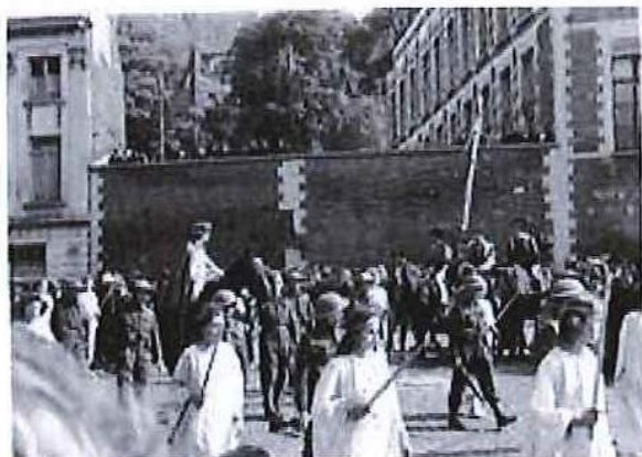
Groupe des Anges de Mons lors de la procession de 1945, dans Fonds photographique des Archives de la Ville de Mons (AVM), n° 39

Le groupe des Anges de Mons en 2014 sera constitué tout d'abord de la banderole le présentant, suivie des drapeaux belge, britannique et européen. Suivent huit jeunes filles portant un glaive et représentants les