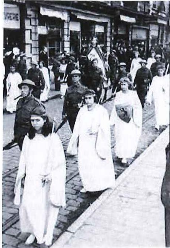
Les Anges de Mons lors de la Procession de 1945, dans Fonds photographique des Montois Cayaux, n° 603.

Grâce aux photographies de 1945, nous pouvons décrire le groupe : nous y découvrons plusieurs soldats britanniques avec l'uniforme de 1918 iden-